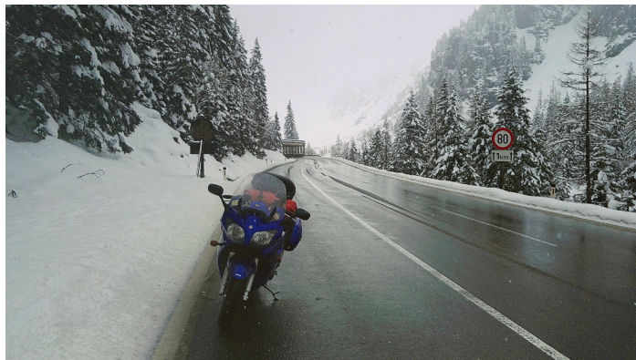
Vappuaaton riemua Alppien ylituksessa

Kohti Alpeja lämpötila alkoi laskea ja pian tien varrella alkoi näkyä lunta. Hymy hyytyi viimeistään siinä vaiheessa, kun noustiin korkeammalle ja lunta oli jo tielläkin. Vappuaatto oli melkoista rämpimistä nollakelissä lumisohjossa. Erään huoltoaseman ukkokööriltä tiedustelimme, vieläkö tie nousee ylemmäs, kun he säälien katsoivat lämmittelyämme. Lienzissä sulattelimme itseämme huppeassa hotellissa ja minä sain ajaa prätäkäni hotellin talliin Lady parking-paikalle. Aamiaisella tarjottiin skumppaa, mikä oli helmiä sioille, kun saman tien piti lähteä ajamaan.