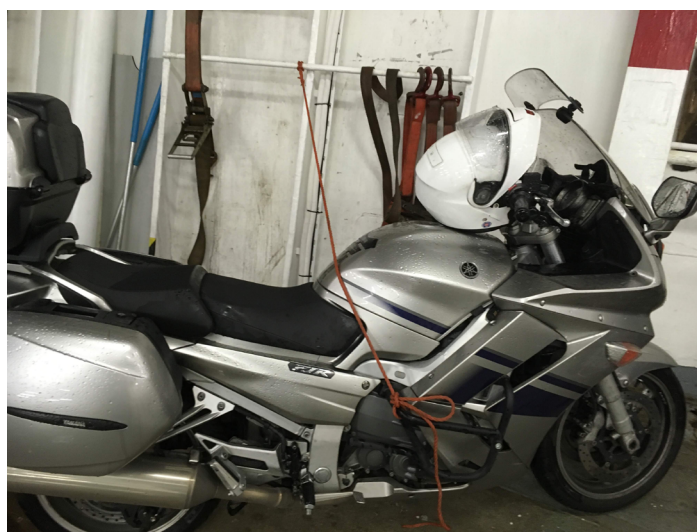
Pyörä "vahvasti" sidottuna myrskyisellä merellä. En sitonut itse

Seuraavaksi oli tarkoitus ajaa sitten saaria pitkin pois Ahvenanmaalta, mutta sitten tulikin ongelma... EI siltä saarelta niin vaan lähdetäkään. Piti sitten selvittää reitti ulos saarelta ja päädyttiin Maarianhamina - Turku laivalle seuraavana päivänä. Onneksi Vaimo kotona pystyi varaamaan matkan netin kautta joten päästiin aika mukavasti liikkeelle. Maarianhaminassa käytiin museossa katsomassa Pommern laiva. Upeaa jälkeä joskus ihmiset ovat käsillään tehneet.