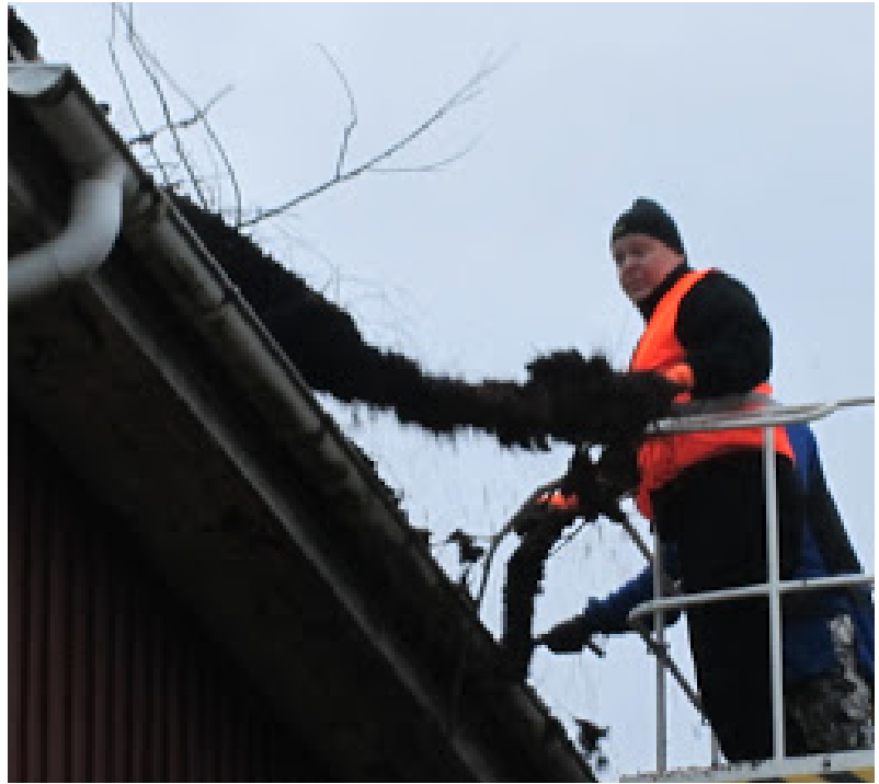
Rännien tyhjennys talkoot 24.11.2012

Mitä tästä kaikesta hyvän seuran ja hyvän mielen lisäksi saa. Talkoisiin osallistuva saa rannekkeen, joka oikeuttaa rallialueelle pääsyn koko viikonlopuksi. Syksymmällä kerho järjestää Varjo Meetingin, johon kaikki talkoolaiset kutsutaan. Varjo on juhla, jossa illan päävieraana esintyy kunnes takki on tyhjä, iso grillattu porsas. Kerho tarjoaa kaiken musiikin, syömisen ja juomisen vissystä viinaan. Hyvästä seurasta vastaat sinä olemalla mukana.