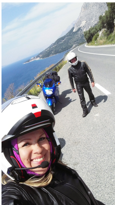
Kroatian kasitie eli rantatie