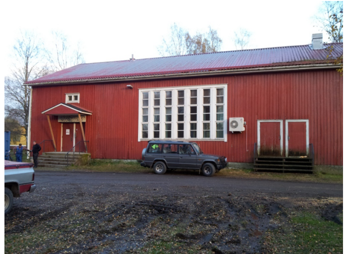
Sirola 12 lokakuuta 2012

Kerhotalo ostettiin 2012, silloin aloitettiin sisäremontilla. Väkeä oli koko kevään talo täynnä lapsista mummoon ja vaariin. Maalattiin, siivottiin ja korjattiin. Kesällä päästiin pihan kimppuun. Koivuja kaadettiin toistakymmentä. Siivottiin sotkut pois, raavittiin nurmikko puhtaaksi ja istutettiin uutta. Pihaan ajettiin 16 kuormaa soraa ja tehtiin uusi portti. Nukuttiin talven yli ja taas kesällä aloitettiin raapimalla ja maalaamalla kerhotalo. Aita nikkaroitiin myös jossakin vaiheessa. En enää edes muista missä vaiheessa mitään tehtiin, mutta kaikki työt toteutettiin kerhon omalla väellä. Omasta väestä löytyi ammattimestä ja naista joka lähtöön. Kuorma-autot, pillari, kaivuri ja nosturit tekivät osuutensa lahjoituksena. Kerho maksoi ainoastaan käytetyt materiaalit.