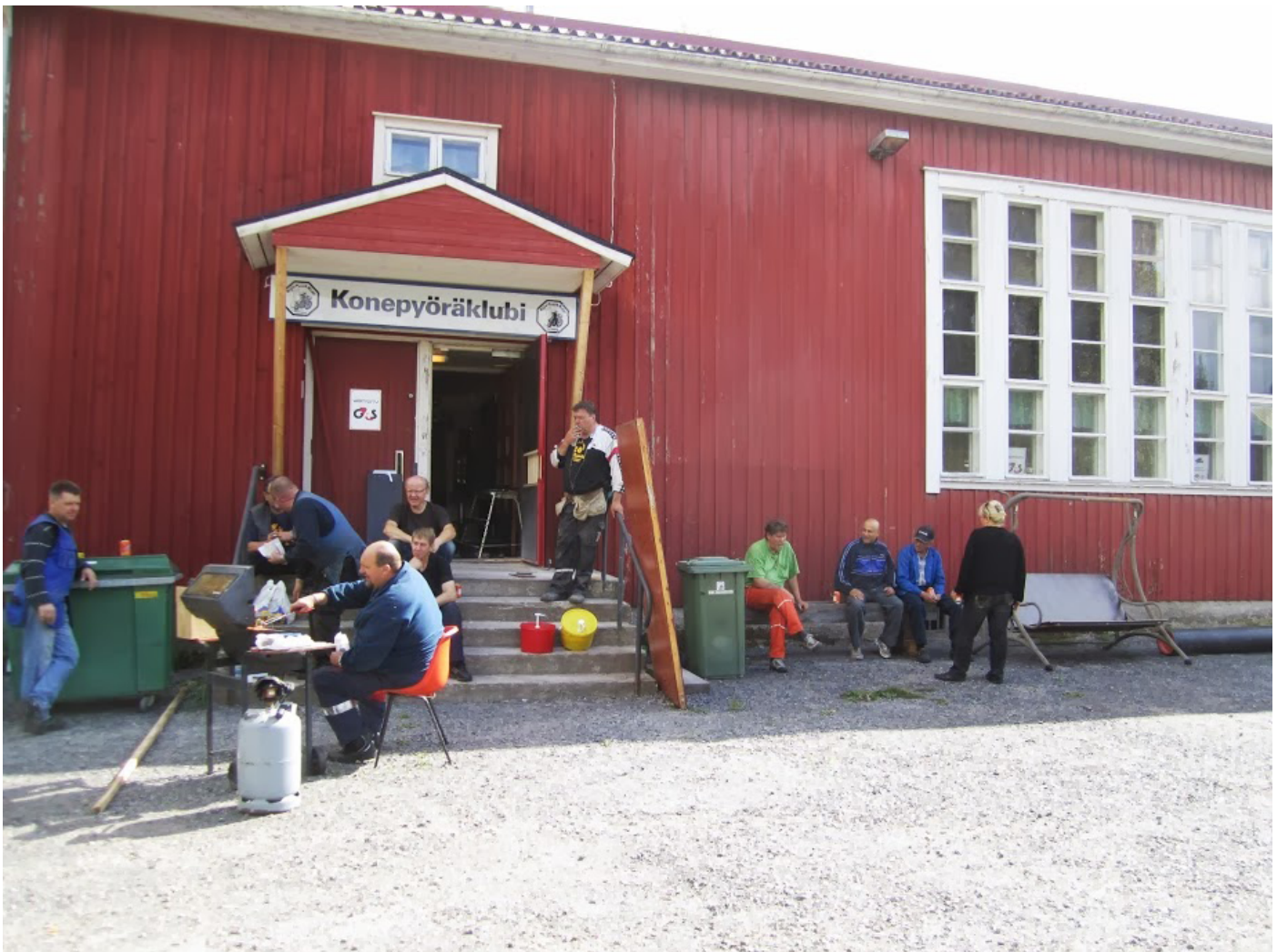
Sirolan talkoot 30 elokuuta 2013