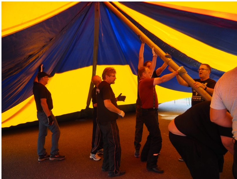
Teltan pystytys Yyterissä 14 elokuuta 2018

Isoimmat hommat on hoidettu. Saamme nyt keskittyä moottoripyöräilyn lisäksi kaiken tämän huoltoon ja kunnossapitoon. Tallimestari huolehtii sisätiloista ja antaa meille tilojen käyttäjille ohjeet. Pitää muistaa, ettei hän ole siellä siivoamassa vaan jokainen siivoaa jälkensä. Ei ole pahitteeksi, mikäli näkee täyden roskiksen vaikka sen tyhjentäisi. Kesän aikana pidetään yleensä siivoustaltoa, laitetaan porukalla paikat kuntoon.