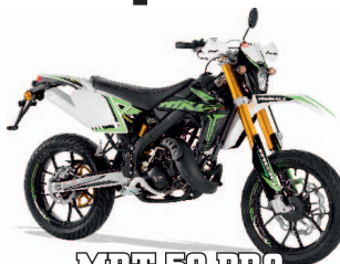
MRT 50 PRO 3990€ +tk