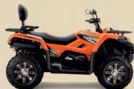
CFORCE 450 5390€ +tk

Traktorimönkijät - rekisteröity kahdelle 3-vuoden takuu ilman kilometrirajoitusta