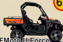
CFMoto U Force 800 Efi EPS 13 250 € +tk