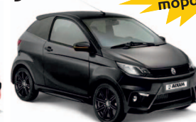
COUPE GTI ABS 16590€ +tk

Mikkolantie 23 • Pori • www.topmotor.fi Puh. 044-010 3771 • myynti@topmotor.fi