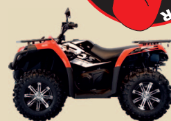
CFORCE 520 6590€ +tk