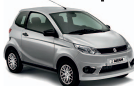
CITY PACK 11390€ +tk