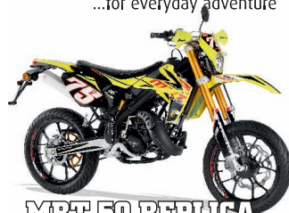
MRT 50 REPLICA 3390€ +tk