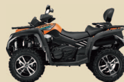
CFORCE 820 8490€ +tk