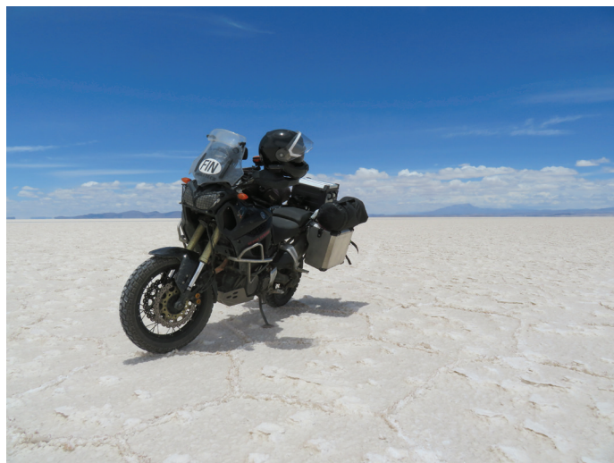
Salar de Uyunin suola-aavikko, Bolivia

oli hieno kokemus. Chile oli vauraamman ja nyky-