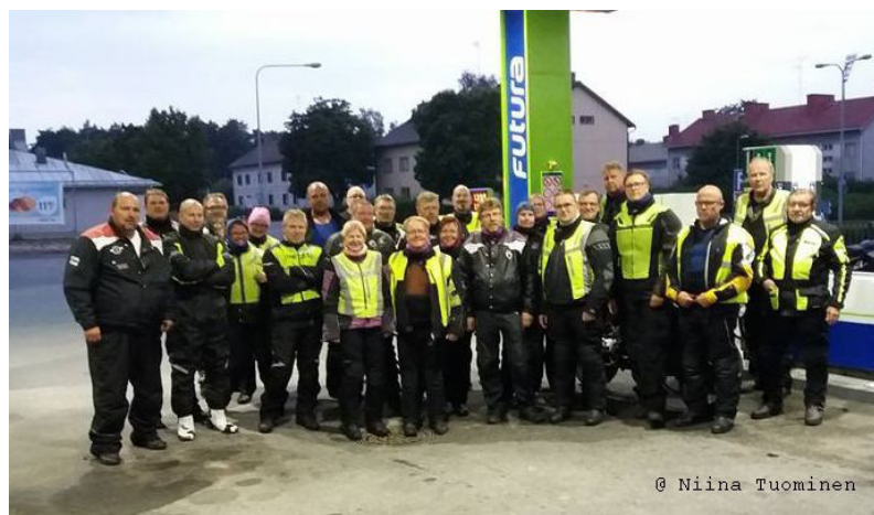
@ Niina Tuominen

Konepyöräklubille on suunniteltu oma SS1000 ajo. Reitti on valmiiksi "pureskeltuna" vain ajamista vaille. Ajosta saa erikoiskunniakirjan. Reitti ja ohjeet löytyy yhdistyksen nettisivuilta www.konepyoraklubi.fi