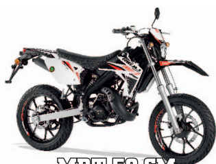
MRT 50 SM 3150€ +tk