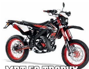
MRT 50 TROPHY 4590€ +tk