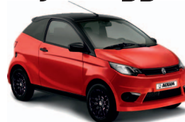
COUPE EVO 13990€ +tk