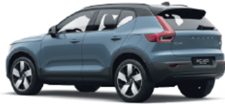
Volvo XC40 Recharge alk. 52.000 €

Volvo XC40 Recharge -mallisto alkaen: autoveroton hinta 51.900 €, autovero 0 €, toimituskulut 600 €, kokonaishinta 52.500 €. Ajoakun käyttökapasiteetti 67-78 kWh, toimintamatka 451-514 km, keskkulutus 17,1-18,0 kWh/100 km, CO2 0 g/km (WLTP). Volvo C40 Recharge -mallisto alkaen: autoveroton hinta 53.400 €, autovero 0 €, toimituskulut 600 €, kokonaishinta 54.000 €. Ajoakun käyttökapasiteetti 67-78 kWh, toimintamatka 471-532 km, keskkulutus 16,5-17,9 kWh/100 km, CO2 0 g/km (WLTP). Toimintamatka- ja kulutusarvot on tarkoitettu ensisijaisesti automallien väliseen vertailuun. Auton kulutukseen ja toimintamatkiaan vaikuttavat muun muassa kuljettajan ajotapa, ajonopeus, lämpötila, keli- ja ajo-olosuhteet sekä auton kuormaus.