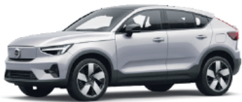
Volvo C40 Recharge alk. 54.000 €